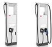
Terra HP 175kW

Inga separata elskåp behövs, vilket sänker installationskostnaderna avsevärt jämfört med andra snabbladdare med hög effekt.