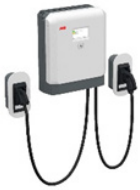
Terra DC 24kW

Kontakta din Toyotaåterförsäljare för vidare konsultation och prisförslag från Caverion.